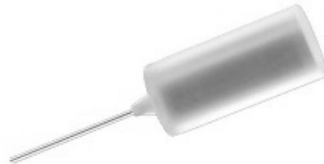
Embout de fibre